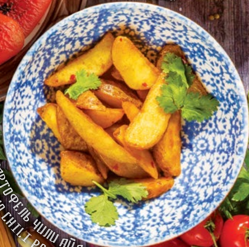
КАРТОФЕЛЬ ЧИЛИ АЙДАХО (170 г) 229.- IDANO CHILI POTATO