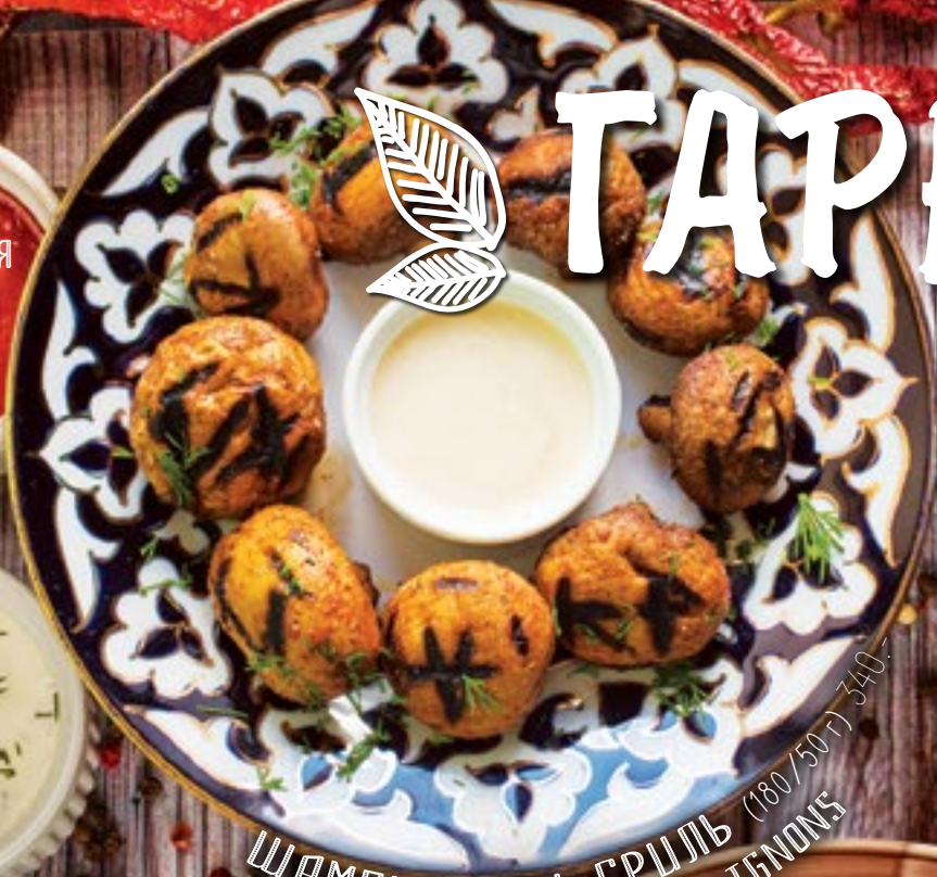
ШАМПИЬОНЫ ГРИЛЬ (180/50 г) 340.- GRILLED SHAMPIGNONS