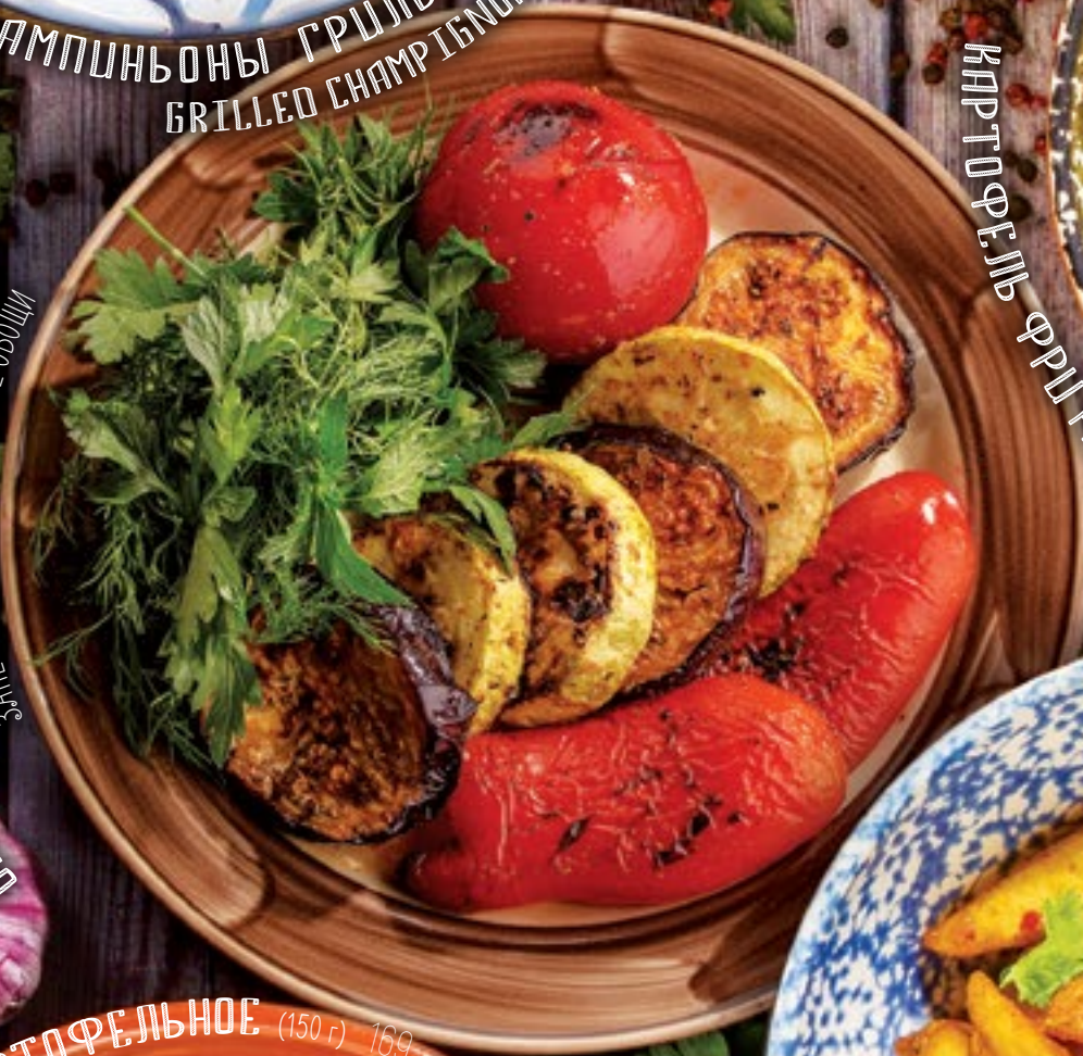
ОВОЩИ ГРИЛЬ (250 г) 339.- GRILLED VEGETABLES 3 ШИЩЕЧНЫЕ НА ОТКРЫТОМ ОГНЕ ОВОЩИ