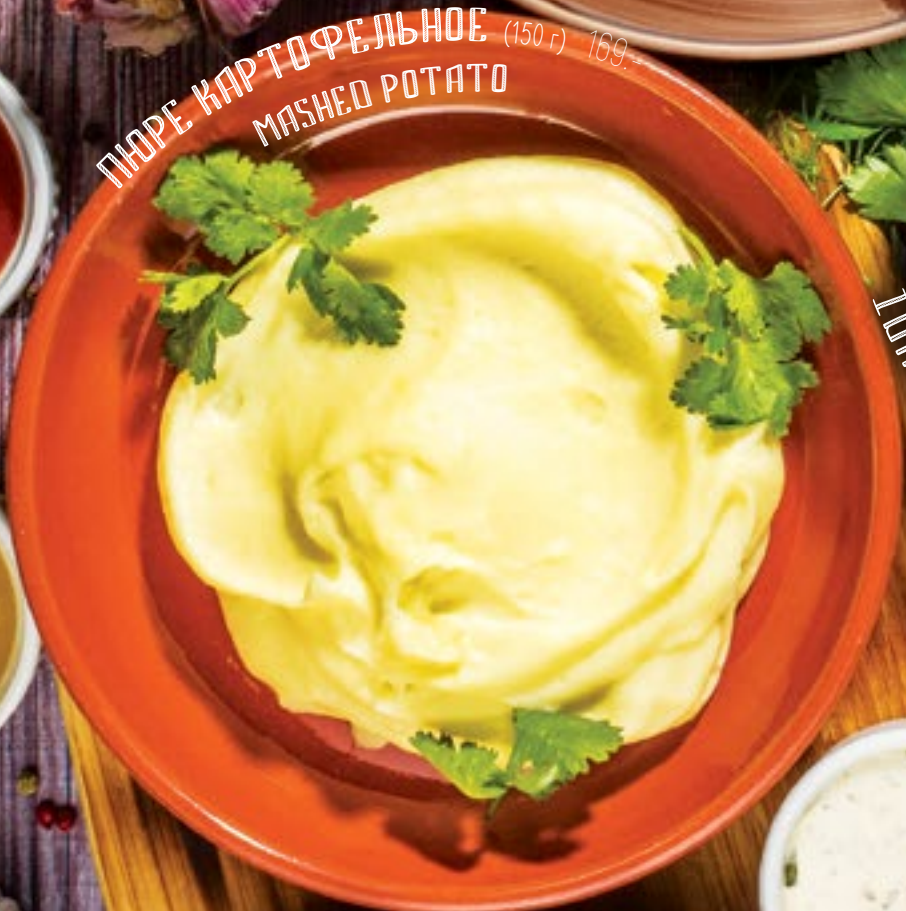
ПУРЕ КАРТОФЕЛЬНОЕ (150 г) 169.- MASHED POTATO